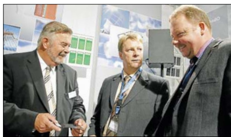
Entertainer Harry Wijnvoord (links) verkaufte bei der Hausmesse von Heroal Lackpflegemittel für den guten Zweck.